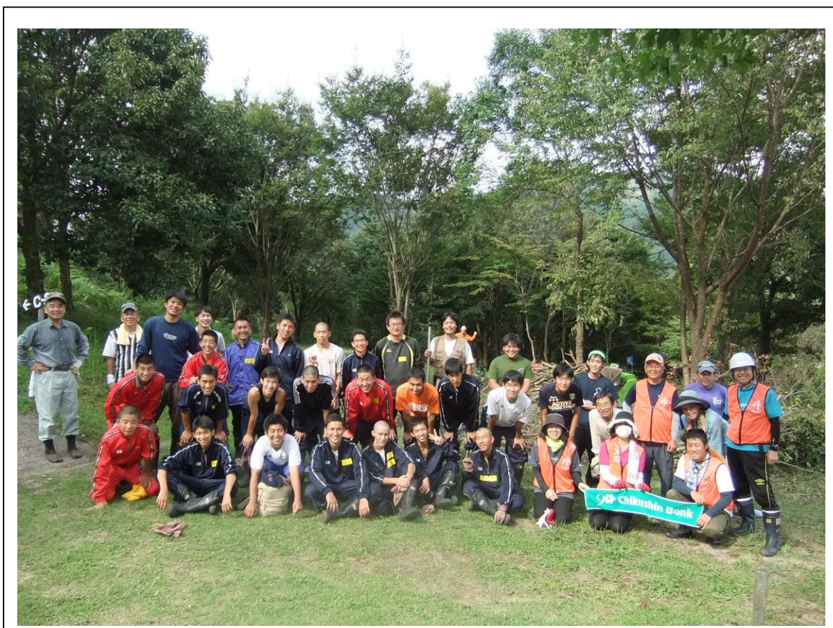
（終了後、参加者全員との記念撮影）