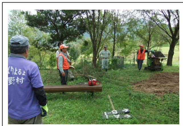
(現地での NPO 法人山口代表の説明)