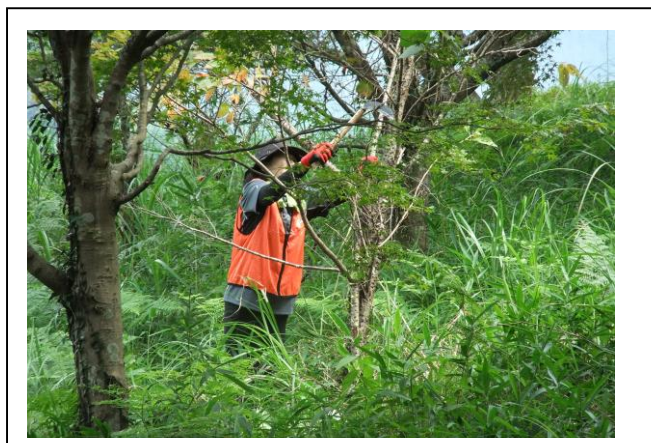
(ナタ鎌で小枝を切断)