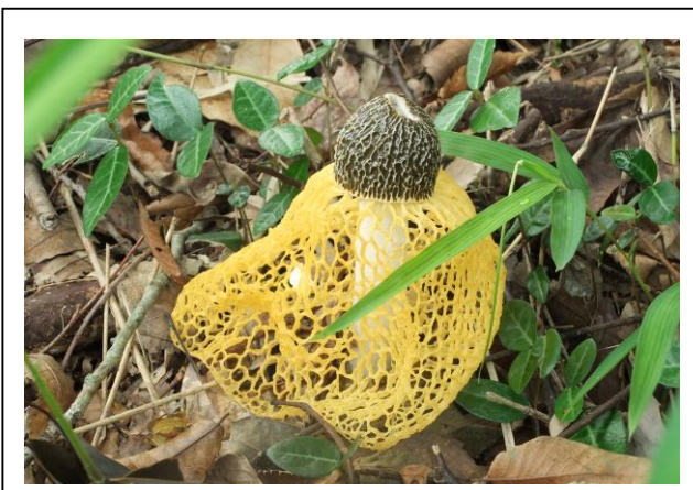
(遊歩道周辺で「キノコの女王」を見つけました。)