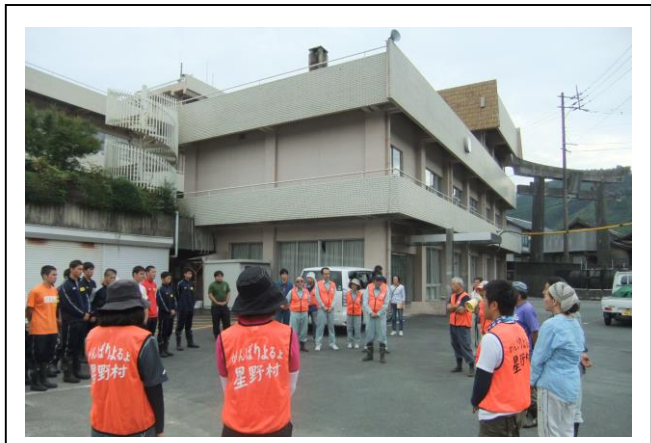
(星野支所駐車場での各団体挨拶)