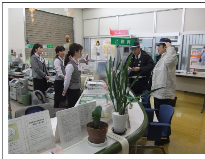
(警察の事情聴取に的確に答える女子職員)