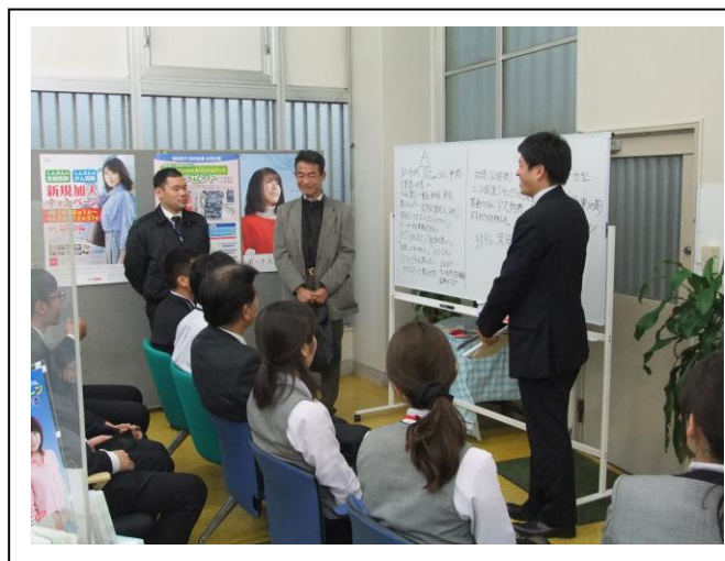
(訓練を終え、総括を真剣に聞く職員一同)