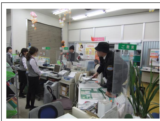
(犯人 2 人組が犯行に及ぶ)

当金庫では、人命の安全確保を最優先として、お客様が安心してご来店いただけるように、役職員一同「防犯意識」を一層高めることに努めていきます。