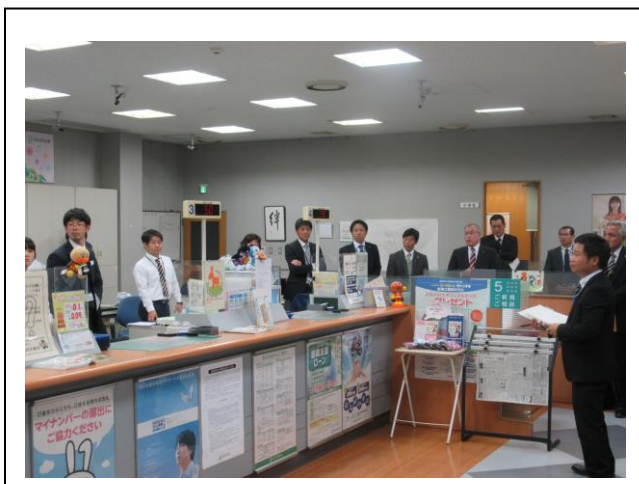
(八女警察署員より講評を受ける職員)