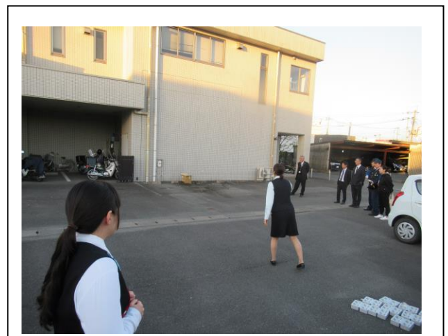
(駐車上で投てき訓練をする女性職員)