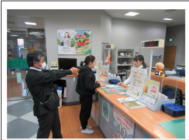
(カウンターで現金を要求する犯人ら)

当金庫では、今後も人命の安全確保を最優先として、お客様が安心してご来店いただけるように、役職員一同「防犯意識」を一層高めることに努めてまいります。