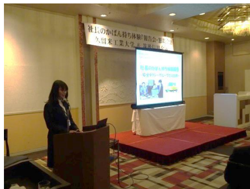
（報告を行う久留米工業大学生）