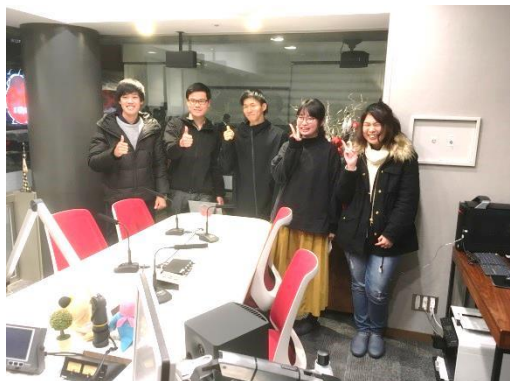
(ドリームスFMで収録を終えた学生達)