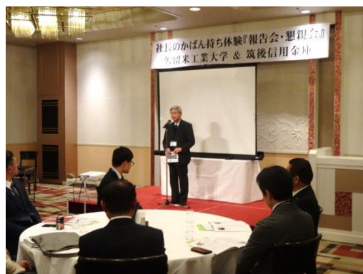
（久留米工業大学 今泉学長）