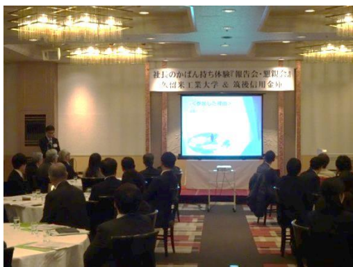
（報告を行う久留米工業大学生）