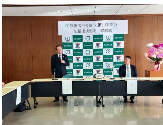
左から、当金庫 江口理事長、島川代表